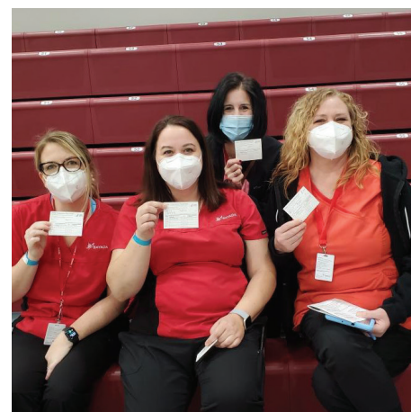
El personal de enfermería de BAYADA muestra orgullosamente sus tarjetas de vacunación.